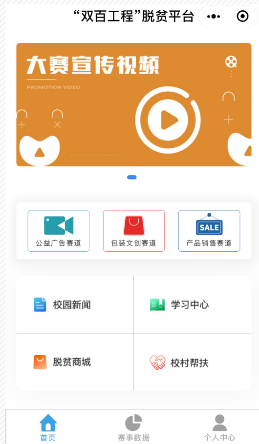
赛事平台小程序首页示意图